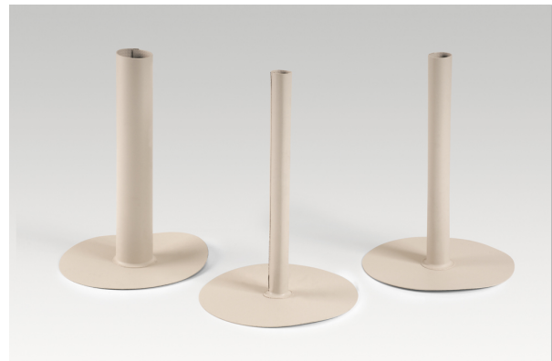
Type P6 (open pipe)